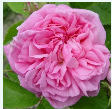
La Ville de Bruxelles

rosa - historisch, alba-rose 120-180 cm sehr stark duftende, den garten erfüllende rose - telt, klassisch rosig James Booth