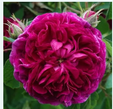
Charles de Mills

rosa - historisch, damaszener rose 135-225 cm sehr stark duftende, von weitem wahrnehmbare rose - süß-würzig, damaszenerartig