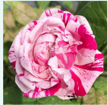
Variegata di Bologna

mittel-rosa - historische, centifolia-rose 120-190 cm sehr stark duftende, schon von weitem wahrnehmbare rose - süßlich, zitrusartig -