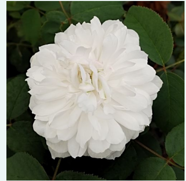
White Jacques Cartier

purpur-lila - historische, gallica-rose 120-190 cm mittelstarke, gut wahrnehmbare duftrose - samtig, leicht beerig-fruchtig -