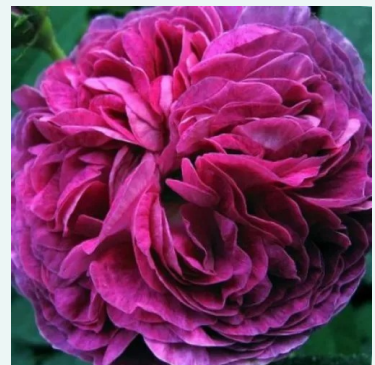
Belle de Crécy

rot - historische, remontierende hybridrose 100-150 cm sehr intensiv, den garten erfüllende rose - reich, altrosenartig Reverchon