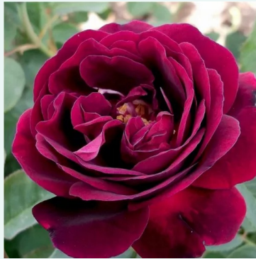
Souvenir du Docteur Jamain

hellrosa - historische rose, bourbonrose 110-160 cm stark, lang anhaltend duftende rose - süßlich, teearomatisch (klassische Teerose) charakter Jean Béluzé