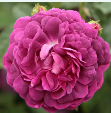
Cardinal de Richelieu

purpur-rot - historische, moosrose 120-190 cm außerst intensiver, den garten erfüllender duftrose - tief würziges aroma Jean Laffay