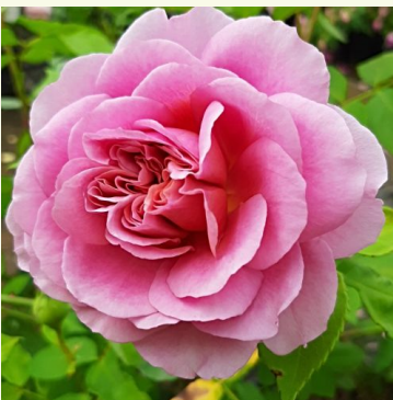
Robe à la française

rosa - nostalgie-rose 70-110 cm stark duftende, gut wahrnehmbare rose - süß, fruchtig PhenoGeno Roses