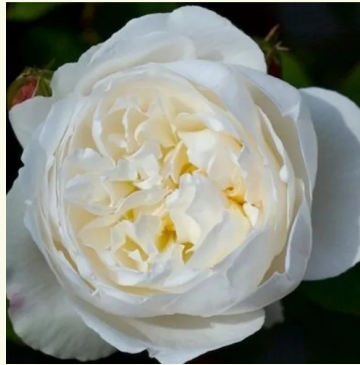
White Mary Rose™

rosa - nostalgie-rose 120-190 cm stark duftende, gut wahrnehmbare rose - frisch, fruchtig John Scarman