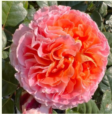
Notre Dame du Rosaire

cremefarben - nostalgierose 100-150 cm intensiv duftende, lang anhaltende rose - duftbeschreibung nicht verfügbar L. Pernille Olesen, Mogens Nyegaard Olesen