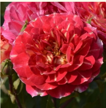
Les Potes de Bedros

rosa - nostalgie-rose 110-170 cm sehr schwach, kaum wahrnehmbar duftende rose - duftbeschreibung nicht verfügbar Alain Meiland