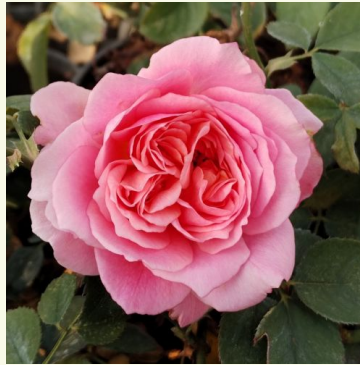
Festival des Jardins de C.

apricot - nostalgische rose 100-150 cm sehr stark duftende, den garten erfüllende rose - klassischer damaszener, rosig Heinrich Schultheis; Henry Bennett