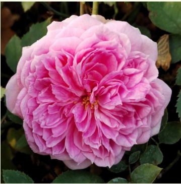
Sophia Romantica ®

korallenrosa - nostalgierose 110-170 cm sehr stark, lang anhaltend duftende rose - klassisch, rosig Dominique Massad