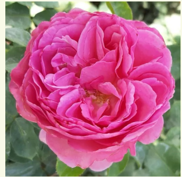
Renée Van Wegberg™

tiefrot - nostalgische rose 75-105 cm sehr schwach, kaum wahrnehmbar duftende rose - feiner, rosiger charakter Meilland International