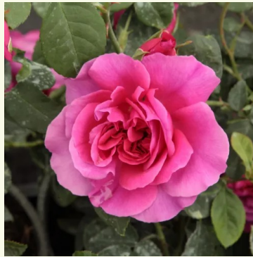
The Dark Lady

weiß-rosa - nostalgische rose 60-85 cm mild, dezent duftende rose - süßlicher charakter Alain Meilland