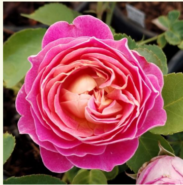
C. de l'Haÿ-les-roses

hell-rosa - nostalgierose 70-100 cm mild, zurückhaltend duftende rose - klassisch, rosiger charakter Biljana Božanić Tanjga