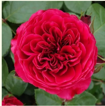
Red Leonardo da Vinci

rosa - nostalgische rose 100-150 cm intensiv, lang anhaltend duftende rose - duftbeschreibung nicht verfügbar Georges Delbard