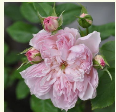
Cecil de Volanges

gold-gelb - nostalgie-rose 80-110 cm sehr schwach, kaum wahrnehmbar duftende rose - diskret, fein im charakter Dominique Massad