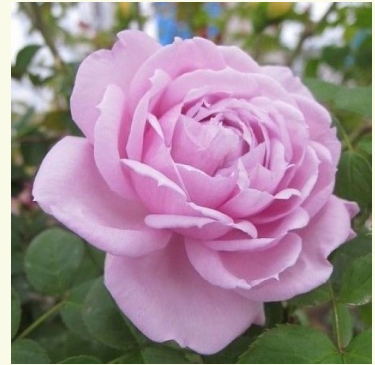
Le Ciel Bleu

malven-lila - nostalgierose 45-65 cm mittelstark duftende, gut wahrnehmbare rose - angenehm süß Biljana Božanić Tanjga